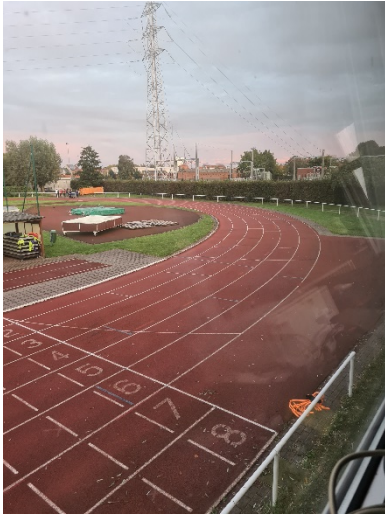
Afscheid van de piste anno 1998

De werken zijn gestart met het verwijderen van de oude topplaat, verwijderen van de balustrade, de discuskooien de steepleput zijn al verdwijnen. De ballenvanger thv de steepleput is ook al gesloopt.