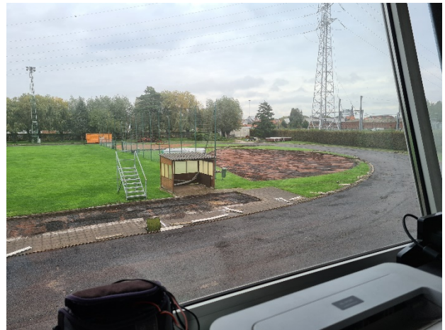
Resultaat na een paar dagen werken

Wanneer zal de renovatie klaar zijn? Hopelijk kan alles zoals gepland doorgaan en kunnen we eind april genieten van een 'waardige atletiekaccommodatie'